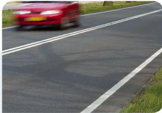
Dubbele doorgetrokken asstreek: niet inhalen.