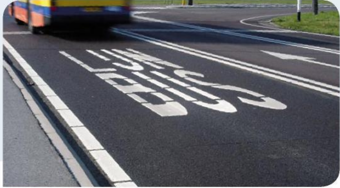
Een busstrook voor bussen van het openbaar vervoer (lijnbus).