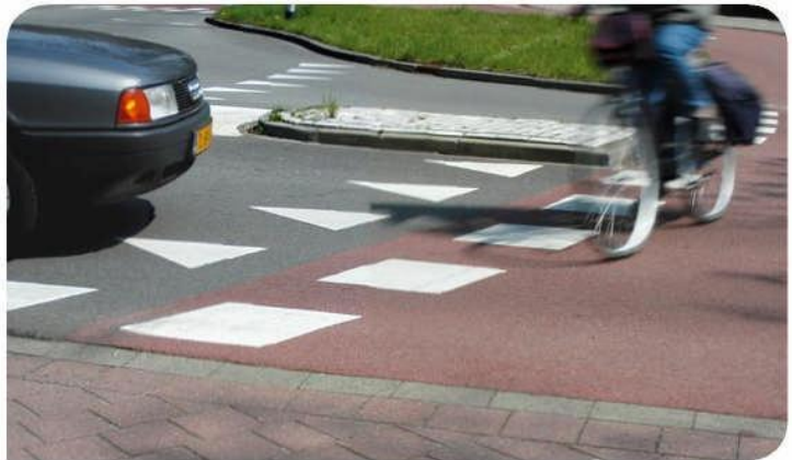
Fietsoversteekplaats met blokstrepen: de haaiantanden regelen de voorrang.