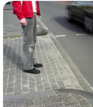
Kanalisatiestrepen: voetgangers hebben