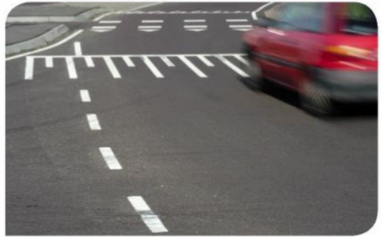
Taludstrepen bij verkeersdrempels geven een hoogteverschil aan.

zodat je hierop tijdig kunt anticiperen. Verkeerstekens zijn als het ware de 'taal van de weg'. En als je de taal begrijpt, kun je veiliger aan het verkeer deelnemen. Je vindt hier nog een paar voorbeelden.