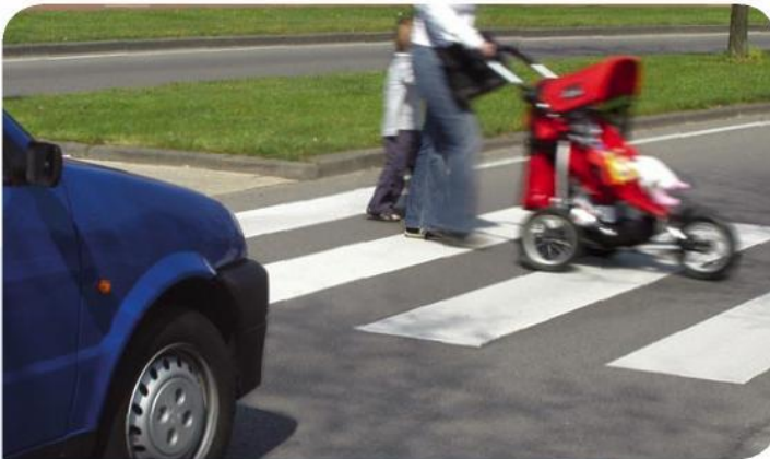
VOP: voetgangers hebben voorrang.

Je hebt hier dan ook als voetganger geen voorrang op het autoverkeer en moet wachten tot de weg vrij is. Wanneer je als automobilist aan het verkeer deelneemt is het overigens verstandig om, ook al heb je voorrang, altijd rekening te houden met plotseling overstekende voetgangers. Vooral kinderen kunnen de situatie niet altijd goed inschatten. Pas dus je snelheid aan in gebieden waar je overstekende voetgangers kunt verwachten, ook als er geen zebra ligt.