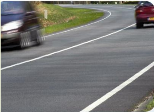
Enkele doorgetrokken asstreek: niet inhalen.