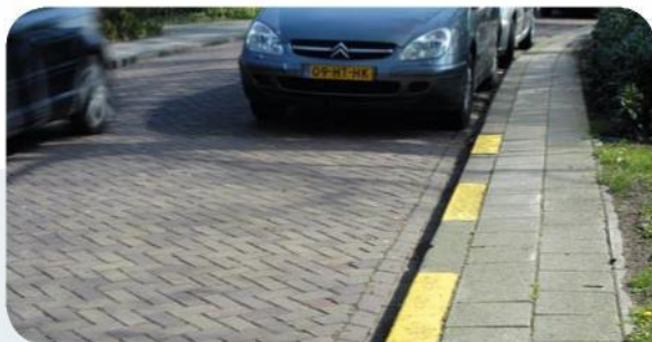
Gele onderbroken streep: niet parkeren.