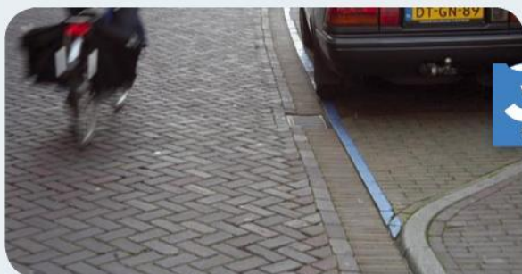
Blauwe streep: parkeren met gebruik van parkeerschijf.

stilstaan (en dus ook niet parkeren). Is de streep onderbroken , dan mag je daar wel evenilstaan (bijvoorbeeld om iemand even te laten uitstappen), maar niet parkeren .