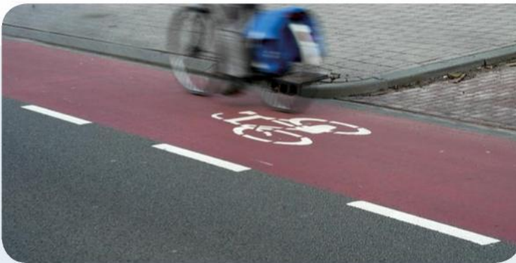
Goed vormgegeven fietsstrook.

Vaak heeft de fietsstrook een kleur, meestal rood. Daarmee worden weggebruikers extra attent gemaakt op de aanwezigheid van de fietsstrook. De kleur bepaalt echter niet de wettelijke status van de strook, het gaat om het symbool: een fietsstrook is alleen een fietsstrook als er een fiets op staat!