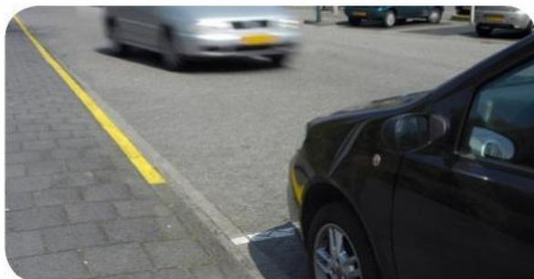
Gele dooraetrokken streep: nietilstaan.

Soms kom je op trottoirbanden gele strepen tegen. Wanneer deze streep is doorgetrokken mag je met de auto langs dat trottoir niet